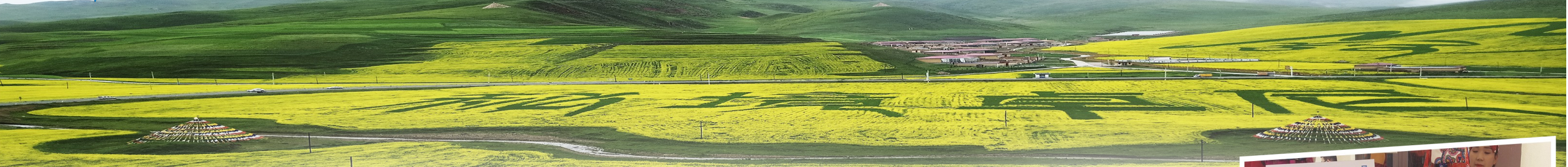
中建集团定点扶贫县景泰县卓尼美丽风光