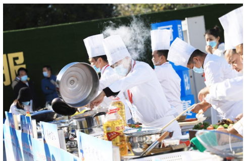
10月23日,中建三局一公司“争先杯”首届厨艺大赛开赛。9组项目厨师代表队和16名职工厨师代表同台竞技,以赛促用,提升餐饮品质和服务质量。(史艺兰)