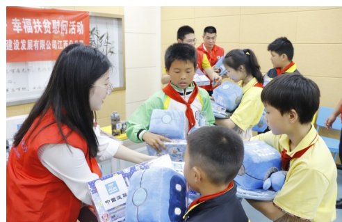
近日,中建四局建设发展公司志愿者到上饶市信州区小学爱心慰问,为35名建档立卡贫困小学生送上爱心文具,连续第3年对信州区朝阳村进行精准扶贫。(游琪)