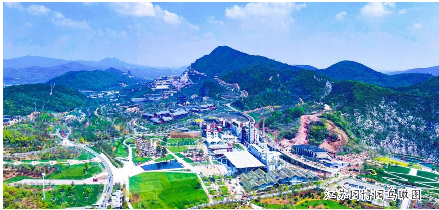
江苏园博园鸟瞰图

中国建筑旗下中建八局以EPC工程总承包模式打造的规模最大、业态最全的世界级文旅山地花园群——江苏园博园项目在第十一届江苏省园艺博览会惊艳亮相。254万平方米园林景观、31万平方米特色房建、24.3公里轨道交通……江苏园博园由一个标志性建筑、两大光智工程、三大形象入口、四大精美花谷、五大精品酒店、六大配套设施组成。项目融合了古建、园林景观、市政、生态治理多种业态与矿坑修复、超大异形曲面结构等多重建设挑战，并肩负着深入贯彻新发展理念、坚持生态优先绿色发展、打造践行“两山”理论标志性样板的使命。