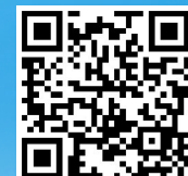
扫码速览中国建筑年报

4月16日,中国建筑(601668.SH)发布2020年年度报告,各项业绩指标再创历史新高。2020年,公司新签合同额首次突破3万亿大关,达3.2万亿元,同比增长11.6%;实现营业收入1.62万亿元,同比增长13.7%;实现归母净利润449.4亿元,同比增长7.3%。作为连续四年成为全球建筑行业唯一新签合同额、营业收入达到“双万亿”的企业,2020年中国建筑首次进入《财富》世界500强前20强,光明日报、经济日报、新华网、人民网、中国证券报、证券时报、证券日报等多家媒体对中国建筑2020年年度报告进行了全方位解读与报道。