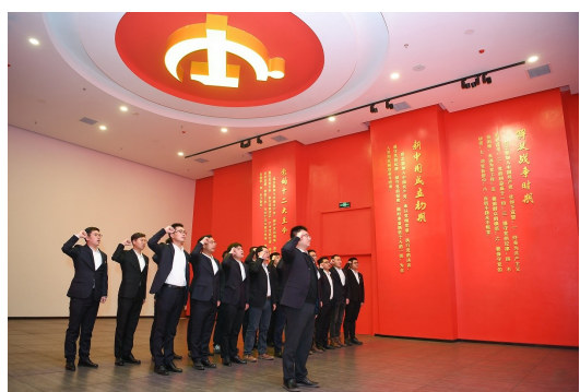
中建三局总承包安装公司中南党总支开展“党史百年线上学”和“红色教育实地学”活动,掀起学党史热潮,因为青年党员在湖南省委党校党性教育馆重温入党誓词。(胡大伟)

结合“我为群众办实事”实践活动,江苏厂党总支提前谋划,做好今年的安排部署。后勤处提供免费提供空余职工宿舍,联动职工超市成套备货生活用品,妥善安排职工及其子女起居,保证孩子们都可以和父母同住生活。设置参观日,各党支部组织在厂职工子女和父母一起参观工厂生产,给家庭陪伴留空间,促进沟通交流。开设暑期安全课堂,为在厂职工子女提供厂区安全、交通安全、日常消防、预防中暑等安全课,提高安全意识,遵守安全规章。划定警示区,凡生产区入口设置儿童禁行牌,同时由家长代表发布安全倡议书,明确应知应会安全事项,切实履行双方看护责任。党总支还积极为职工子女搭建一个学习和展示平台,组织前往艺术馆参加绘画、手工及合唱活动,在厂举办艺术展览出学习实践成果,也举办小型文艺演出,邀请孩子们上台展示才艺,既促进交流交友,也丰富生活和学习。