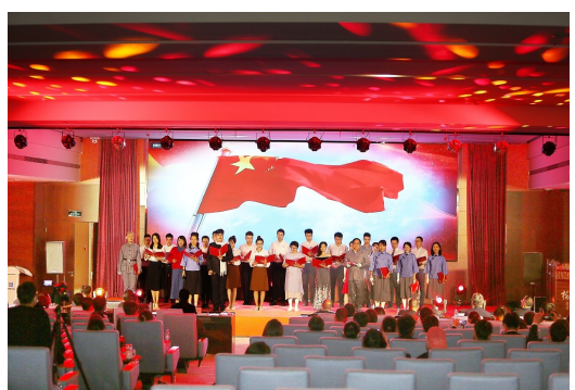
中建技术中心举办“颂百年初心,汇奋斗力量”红色经典朗诵会,党员职工在诵读中重温历史,抒发对革命先烈的崇敬,更坚定全体职工“永远跟党走”的决心。(高亚娜)