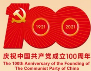
庆祝中国共产党成立100周年 The 100th Anniversary of the Founding of The Communist Party of China