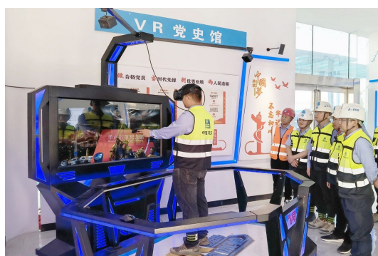
中建七局安装公司商丘金融中心项目创新性利用5G+VR技术,将历史场景搬进现实,以重大历史事件为主要内容,通过场景再现开启“沉浸式”学习新模式。(王健哲)