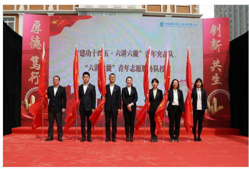
4月29日，中建六局团委开展“学党史 强信念 跟党走——青春向党·奋斗强国”五四主题活动，以多种形式弘扬五四精神，厚植爱国情怀。（刘志远）