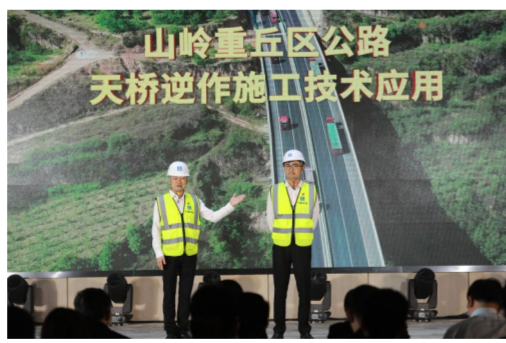
4月30日，中建七局团委举办纪念共青团成立99周年大会暨第三届青年“创新创效”成果展示大赛，展示青年科技创新、管理提升成效。（李君贤）