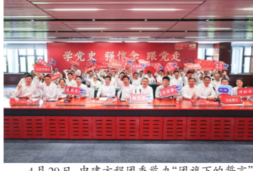
4月29日，中建方程团委举办“团旗下的誓言”五四主题活动，以青年党史知识竞赛形式，推进党史学习教育在青年中走深走实。（丁汀）