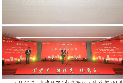
4月22日，中建丝路（中建西北区域总部）团委牵头中建系统内10余家单位成立“建证”志愿服务队，以服务第十四届全运会与残运会。（王筱雨）