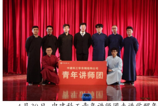
4月30日，中建科工青年讲师团走进觉醒年代，化身李大钊、陈独秀等五四灵魂人物，再现《庶民的胜利》《敬告青年》等经典演说。（徐森）