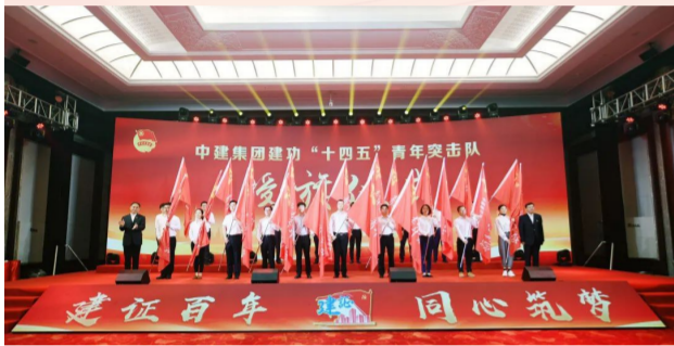
传承五四精神 立大志明大德

中建集团团委在武汉举办“建证百年 同心筑梦——学党史、强信念、跟党走”庆祝建党100周年演讲比赛暨青春建功“十四五”行动启动仪式，重温党的光辉历程，礼赞党的伟大成就，继承革命优良传统，为实现集团“一创五强”战略目标凝聚青春智慧。集团子企业也围绕五四主题开展丰富多彩的青年活动。