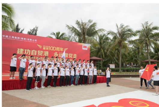
中建三局海南公司100余名职工参加“建证百年 同心筑梦”健身走活动,在活动中设置的唱支红歌给党听、我与党旗合个影、党史知识我来答、你划我猜学党史等打卡点完成趣味互动,学用结合,体悟党史学习教育内涵。(严钰景)