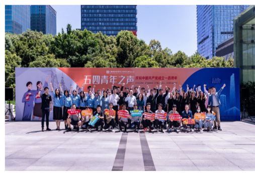
4月29日，中建西南院青年在成都以文艺快闪、歌唱加舞蹈的方式，展现青春心向党、建功新时代的的决心和信心。（邓成兵）