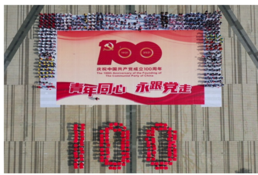
4月27日，中建四局团委联合江门团市委开展“青年同心·永跟党走”青年红色经典传唱大型快闪主题活动。（张旭晖）