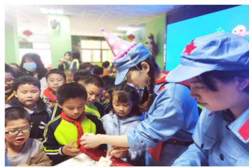
五一期间，中建五局团委组织团员青年赴红船精神文化馆，将党史小故事和科普知识送到周边小学，为小学生过集体生日。（余雯琪）