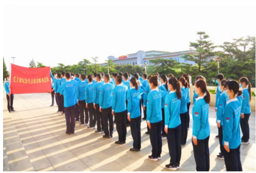
4月27日，中建一局团委组建疫情以来毛主席纪念馆首支志愿服务队伍，开展为期14天的志愿服务工作，展示中建风采。（杨亚凯）