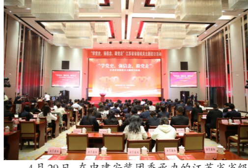
4月29日，在中建安装团委承办的江苏省省级机关五四主题团日活动上，其“工匠兄弟连”主题宣讲在线点击量超3万余人次。（陈琛）