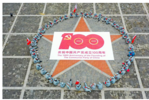
4月22日，中建三局团委组织团员青年前往武汉黄陂抗战第一村——姚家山开展“红色基地忆党史 不忘初心跟党走”主题活动。（王劲松、徐鹏程）