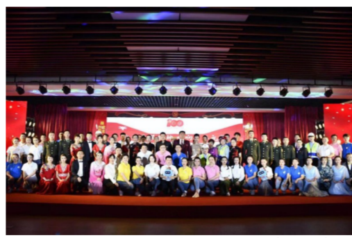
4月29日，中建新疆建工团委组织青年代表与新疆维吾尔自治区青联委员、解放军某部队联建开展“青春心向党”红色快闪活动。（孙雪）