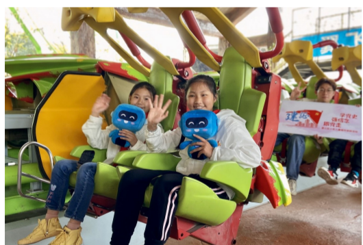
中建二局与重庆团市委共同开展“建证百年 同心筑梦——学党史、强信念、跟党走”关心关爱留守少年儿童成长行动。重庆市綦江区打通镇小学60余名小朋友在城市里度过了充实的周末,激发学习热情。(黄海玲、夏天)

中建八局把党史学习教育同推进农民工岗位技能提升培训深度融合,支持岗位成才,采取“送教上门”的形式,将获得省级荣誉奖项的实操教师请到项目工地进行实操教学,授课形式新颖、授课内容丰富,为后续培训积累了经验。