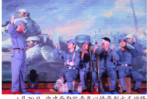
4月29日，中建西勘院青年以情景剧方式演绎百年党史，回顾党的光辉奋斗史，感悟伟大历程，凝聚奋进力量。（曾梓霖）