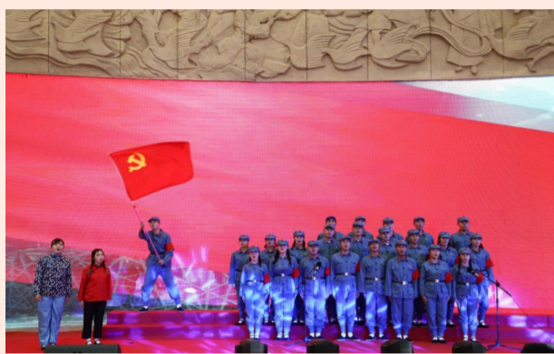
中建四局一公司在贵阳市城乡规划展览馆开展“建证百年 同心筑梦”庆祝建党100周年红歌大赛，唱响红色经典，致敬百年征程。（陈艾君）