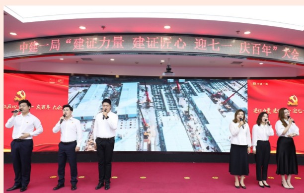
中建一局在京召开“两优一先”表彰大会，党员职工现场演绎党史故事《信仰的味道》、情景剧《百年从此启航》，演唱歌曲《风雨百年》，朗诵诗歌《一路走来》。（品萱）