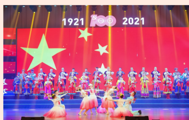
中建西部建设“奋进新时代·开启新征程”主题歌咏晚会上，来自7个省份的1200名员工载歌载舞，庆祝中国共产党成立100周年，热情讴歌伟大新时代。（谢葆兰）