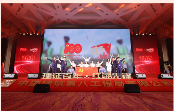
“建证百年·红色先锋”中建八局庆祝建党100周年暨“两优一先”表彰大会回顾中国共产党光辉历程，讲述中建八局奋斗故事，抒发八局人的爱党心、报国情。（王萍）