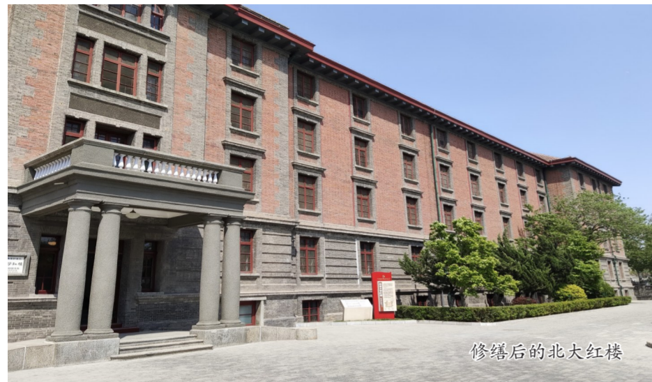
修缮后的北大红楼