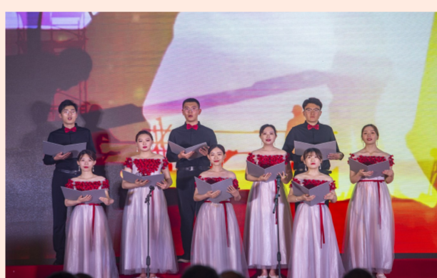
中建安装举办“建证百年 红色向党”七一大型主题活动，高“燃”演绎共产党百年奋斗史和企业40余年的奋进路，线上约1.7万人观看直播。（安宣）