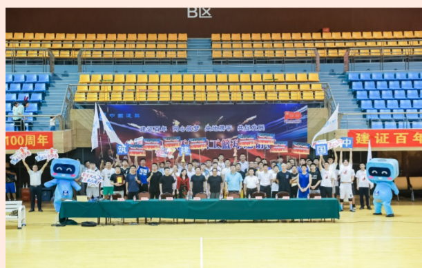
中建基础重庆公司组织中建在渝单位开展“建证百年同心筑梦 央地携手 共促发展”——“中建巴渝杯”职工篮球联赛，共同庆祝建党100周年。（张健铭）