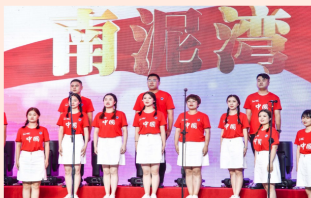
中建二局西南公司举办“最美歌声献给党”职工歌咏会，300余名一线建设者共同庆祝中国共产党成立100周年，讴歌建党百年成就，礼赞建党百年辉煌。（饶昕昕）