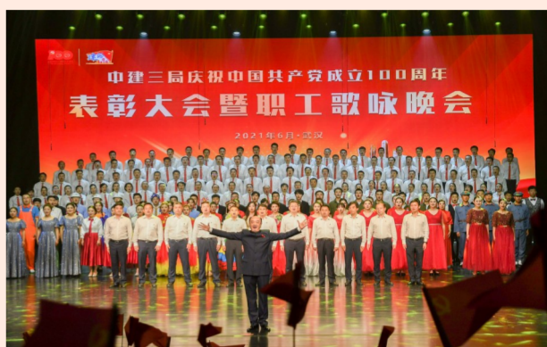
中建三局1700余建设者在庆祝中国共产党成立100周年表彰大会暨职工歌咏会上，唱响红色主旋律，回顾峥嵘岁月，礼赞伟大时代，讴歌美好明天。（钟三轩）