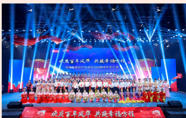
中建方组“建证力量 建证匠心 迎七一 庆百年”庆祝建党百年主题活动，对2020年度“两优一先”进行表彰，并在文艺汇演中将主题活动推向高潮。（方程）