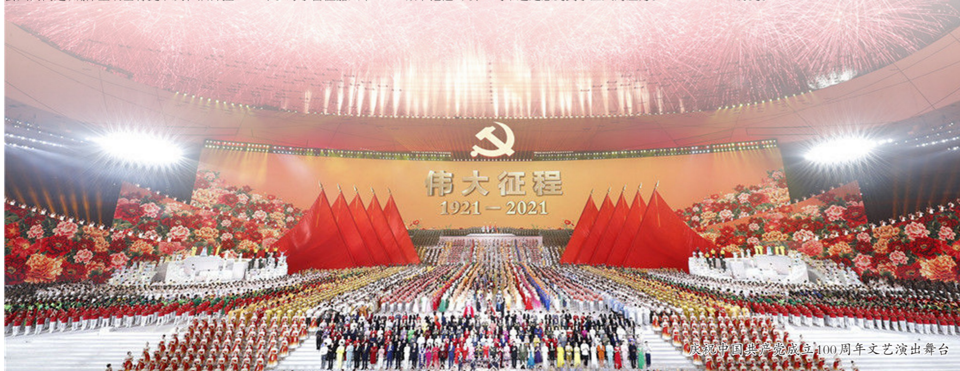
庆祝中国共产党成立100周年文艺演出舞台

会议设1个主会场和467个视频分会场。集团党组成员、股份公司领导,总部部门主要负责人,部分二级子企业及总部派出机构主要领导和受表彰代表在主会场参会;集团总部高级经理及以上人员,二、三级子企业班子成员及部门负责人和受表彰组织、个人共计近1万人在视频分会场参会。