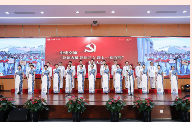
中建交通举办“建证力量 建证匠心 迎七一 庆百年”表彰大会，中建交通总部及子企业的百余名党员职工共唱红歌，“声”情告白，为党和祖国献上祝福。（纪舒玮）