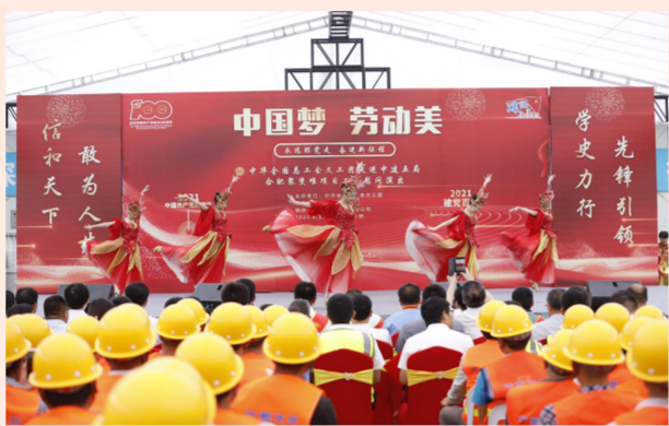
中建五局合肥聚变堆项目300余名建设者在“中国梦·劳动美——永远跟党走 奋进新征程”主题演出中感受伟大时代，礼赞党的百年华诞。（徐辉）