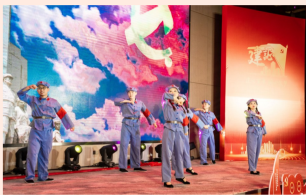
中建七局举办“建证力量·党旗飘扬”庆祝建党100周年“七一”表彰大会，开展沉浸式党课，回顾党的百年历史，弘扬党的优良传统。（邢洛可、肖微）