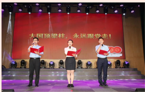
中建六局举办庆祝中国共产党成立100周年表彰大会暨主题展演，节目形式多样，异彩纷呈，情景朗诵《红色家书》、红歌联唱将活动气氛推向高潮。（陆轩）