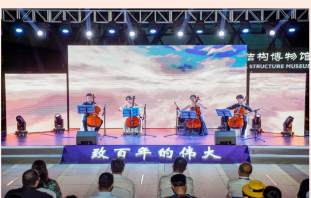
中建科工在深圳中国钢结构博物馆下沉式广场举办“致百年的伟大”专场音乐会，观众们在《映山红》《红星歌》《歌唱祖国》等经典作品中致敬百年伟大历程。（沈希栋）