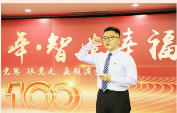
中建设计集团直营总部举办庆祝中国共产党成立100周年主题演讲比赛，33位选手围绕党的非凡历程，演绎红色基因，发扬先锋精神，争做更上一层楼的攀登者，在实干中成就一番事业。争做时代先锋，加油！（于紫硕）