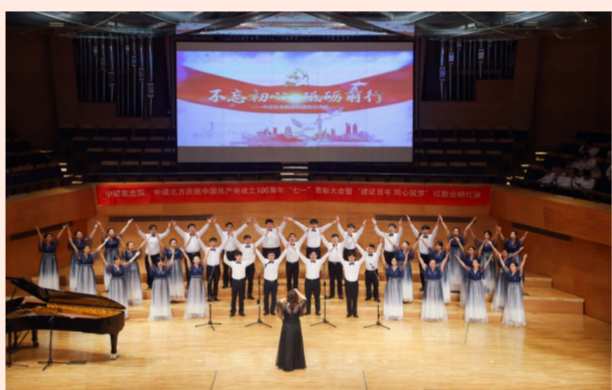
中建东北院、中建北方在沈阳联合举办“建证百年 同心筑梦”红歌合唱比赛，21支队伍、900余名演职人员用歌声点燃爱党热情，用歌声唱响时代强音。（李崇、侯拓）