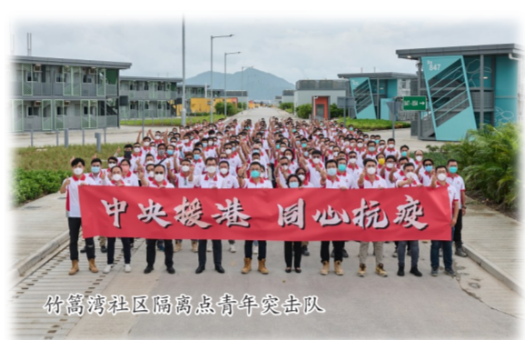
竹篙湾社区隔离点青年突击队

四年的内地求学，让我拥有了更开阔的视野，上了一个全新的平台。在校内，我参加了很多社团，也参加了许多重大活动，接触了很多老