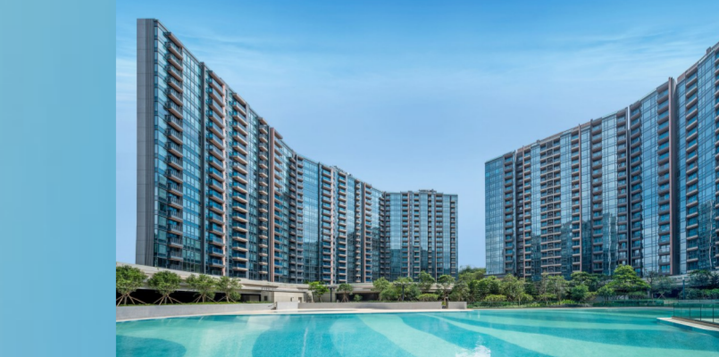
2019年全港全垒垒球冠军“乒坛六甲”住宅项目