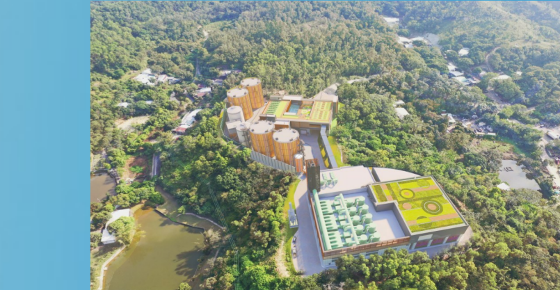
香港东涌海福花园三期工程