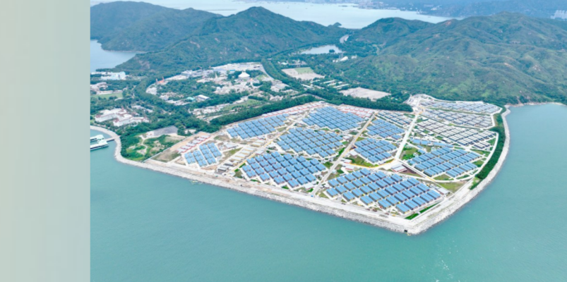
竹篙湾社区隔离治疗设施