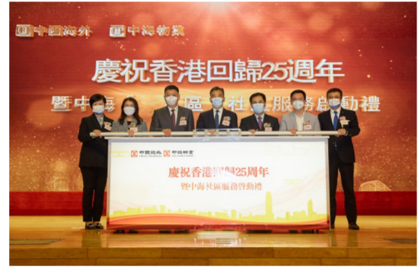
中海集团开展“服务进社区”