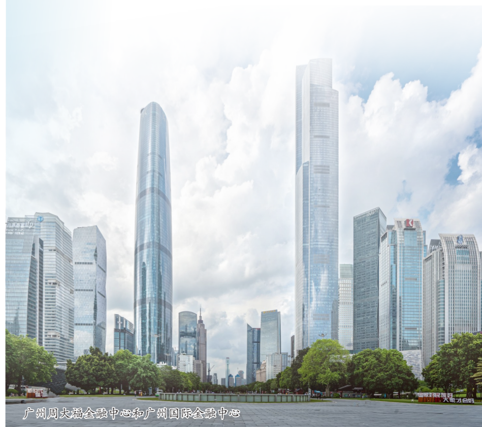
广州周大福金融中心和广州国际金融中心