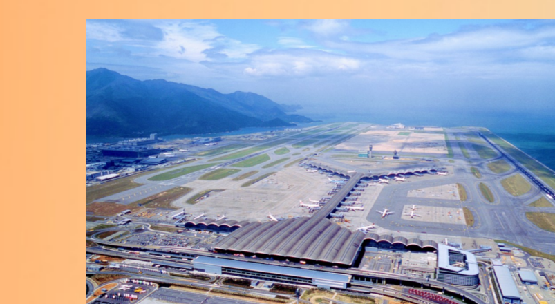
香港新机场客运大楼

“我们是一国两制”在香港实践的见证者、参与者和受益者。没有“一国两制”在香港的成功实践,就不可能有中国海外集团的发展壮大。”