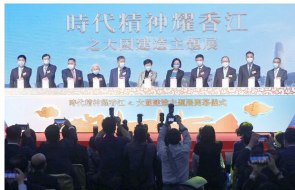
中海集团在香港承办“时代精神耀香江”之大国建造系列活动