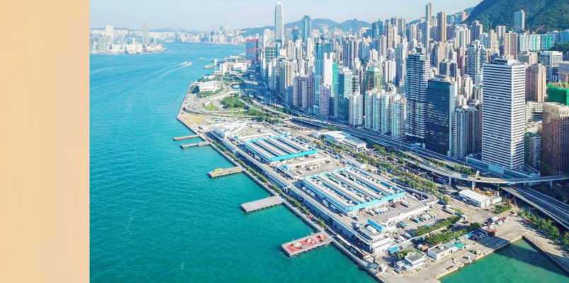
香港西贡区副食品批发市场