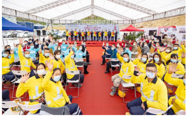
中海集团启动“冬至关爱送暖,幸福你我之间”安全推广服务