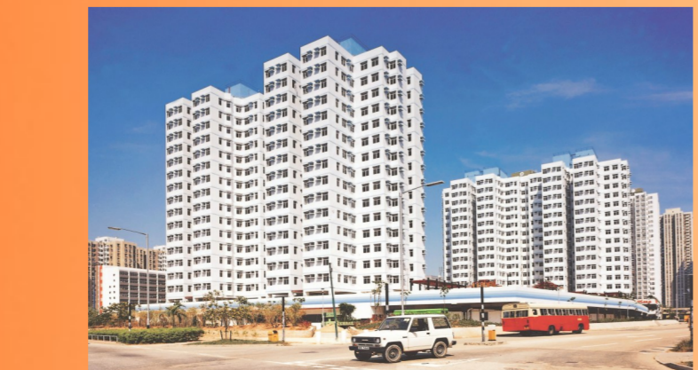
香港海宝花园项目

“以我们所在的建筑行业来说,香港云集了大批国际知名承建商,市场准入严格、运作规范透明、总体管理水平高。”