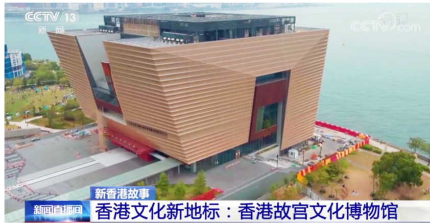
新香港故宫 香港文化新地标：香港故宫文化博物馆