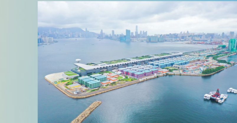
启德社区隔离治疗设施