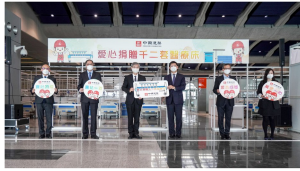
第五波疫情期间,中海集团向香港特区政府捐赠1200套医疗床