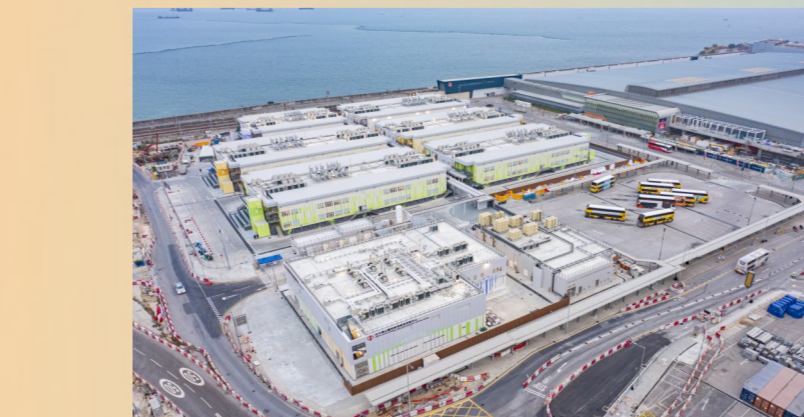
北大屿山医院香港感染控制中心