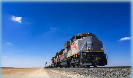
中建中东公司承建的第一条铁路项目——伊提哈德铁路网2A标段