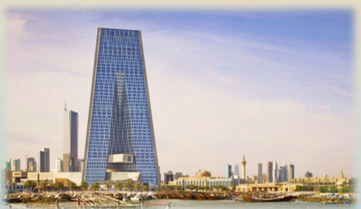
科威特中央银行获中国土木工程詹天佑奖,该建筑被印在了科威特法定货币上。