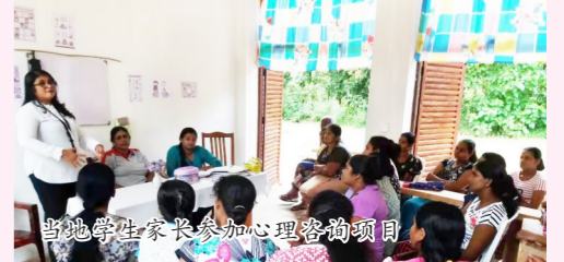
当地学生家长参加心理咨询项目

建筑,从来都不是冰冷无言的,它承载着人们对美好生活的向往。而装饰,在糅合了光、色彩与空间后,赋予了建筑更多生命的力量,用它独特的魅力,拉近人与人、心与心的距离。在“一带一路”建设的道路上,在巴基斯坦、在柬埔寨、在缅甸、在马来西亚、在斯里兰卡……中建装饰将中国标准、中国品质带到更多海外国家,打造精品工程,惠及当地民生,穿越千山万水,只为世界人民拓展幸福空间。