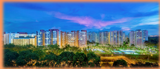
淡滨尼政府组屋N4C28项目

纵观历史、立足当前、展望未来,中建南洋将持续加强战略谋划,做好联结中新两国友谊的桥梁,努力打造“一带一路”建设闪亮名片,为实现中建集团“一创五强”战略目标作出新的贡献。