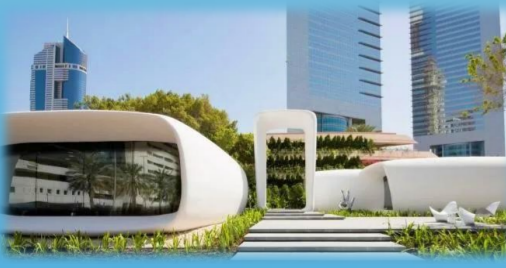
世界首个3D打印商用建筑“未来办公室”