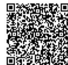
扫码关注更多资讯

如今,污水处理厂投运已近一年,不仅实现科技治污,还成为城市“氧吧”,打造出一张人与自然和谐共生的“生态名片”。