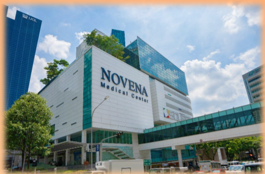
诺维娜医疗中心项目