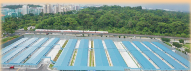
蔡厝港工人宿舍项目