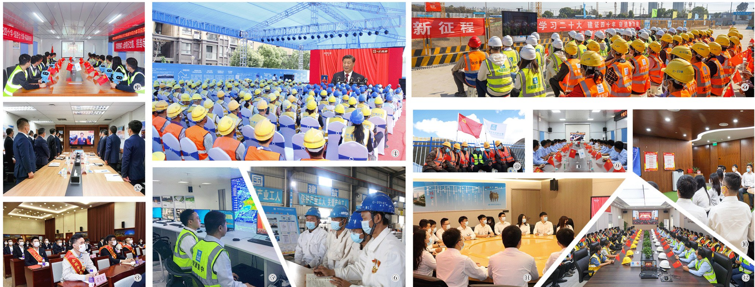
图①中建七局一公司开封黄河大街南延城市更新项目 图②中建国际亚大公司 图③中建一局建设发展公司 图④中建四局常熟UWC+创新岛项目 图⑤中建发展中建智能西安小寨智慧海绵城市监控中心 图⑥中建二局中建电力防城港核电项目 图⑦中建三局光谷人民医院项目 图⑧中国建筑四川省甘孜藏族自治州高原项目 图⑨中建交通钦州港金鼓新城I标项目 图⑩中建资本总部 图⑪中建五局中建信和地产重庆区域团总支 图⑫中建科工重庆联合产业孵化基地项目

吾辈生逢盛世,自当奋斗其时。党的二十大报告指出,当代中国青年生逢其时,施展才干的舞台无比广阔,实现梦想的前景无比光明。作为国家重点基础设施工程建设中的一名基层建设者,我始终把艰苦环境、急难险重任务等作为锤炼精神素养、提升能力水平的“主战场”,将建设一座工程、造福一方百姓作为自己扎根一线的青春追求,努力成长为一名服务基层的守望者、项目建设的奋斗者、基层故事的讲述者,为实现中华民族伟大复兴的中国梦贡献力量,以实际行动让青春在全面建设社会主义现代化国家的火热实践中绽放绚丽之花,为雪域高原增光添彩。