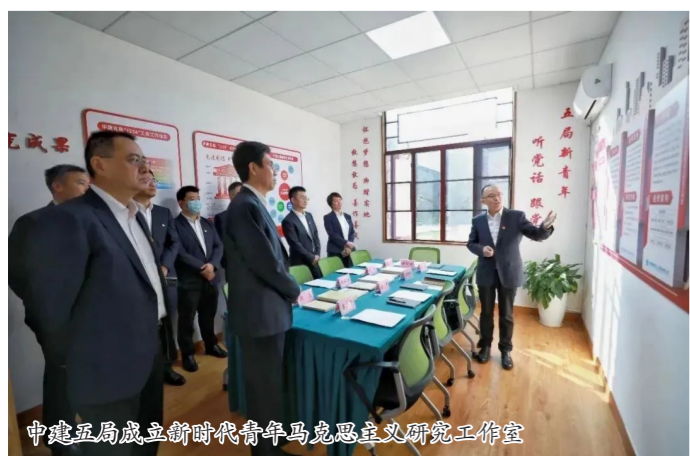
中建五局成立新时代青年马克思主义研究工作室