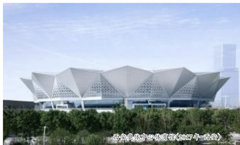
西安奥体中心体育馆(2017年·西安)

1952年，在挺起新中国工业脊梁的东北沃土上，中建东北院因时受命，应运而生。在恢复国民经济、开展各项建设的时代浪潮中，以启山林，上下求索，为共和国工业、国防、现代化建设作出历史性贡献……走过芳华璀璨的70年，中建东北院始终初心如磐，坚定不移服务党和国家事业发展，用一技之长书写爱国志士。