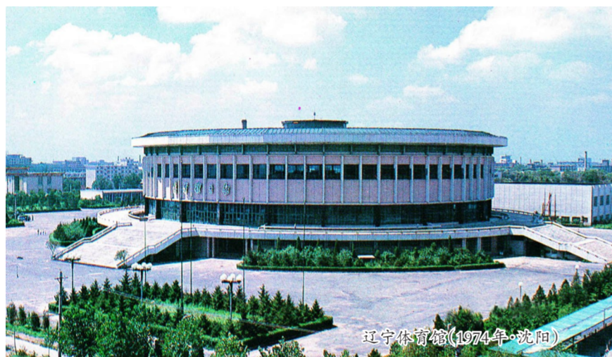
辽宁体育馆(1974年·沈阳)