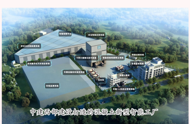
中建西部建设打造的混凝土新型智能工厂

中建东北院立足企业改革重组发展机遇和实际工作中面临的新情况新问题,坚持以调研谋新,以调研开路,着力解决一批发展所需、改革所急、基层所盼的焦点问题。坚持聚焦重点抓推动、一体贯通抓落实,把推动公司高质量发展作为抓实主题教育的着力点,围绕实施战略重组、科技创新等重点工作,制定10项领导班子“1+1”调研课题,深入基层召开发展战略研讨会,开展基层联系点调研,探索设计+投资产业链联动的主要方式及推进实现重组目标的主要路径,科学制定“一二三四六”高质量发展战略目标,擘画企业改革发展蓝图,进一步把握发展方向,理清发展思路,提振发展信心。