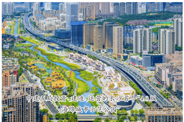
中建五局投资、建造、运营的长沙首个“4.0版海绵城市示范公园”

各子企业切实增强做好主题教育的政治责任感和历史使命感,迅速部署主题教育工作,成立领导机构和工作机构,确保主题教育深入有序推进。