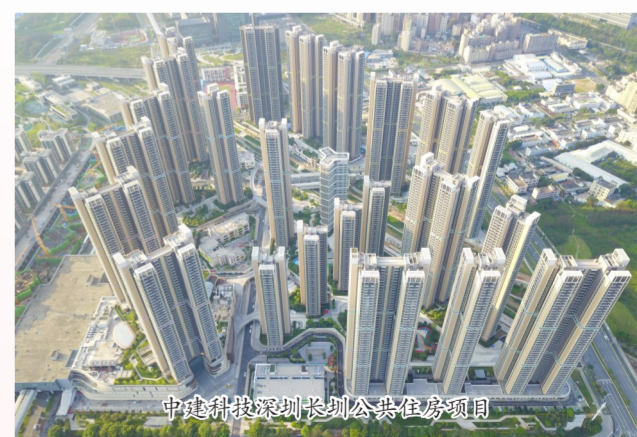
中建科技深圳圳圳公寓住房项目

通过引入“沙盘模拟”和“结构化思维”,帮助学员们快速实现角色转变,提升团队管理能力和职业素养。设置锤炼营工作坊项目,开展传递培训,实现“培训一班人,影响一群人”,进一步提升新时代青年对“有理想、敢担当、能吃苦、肯奋斗”的思想认知。