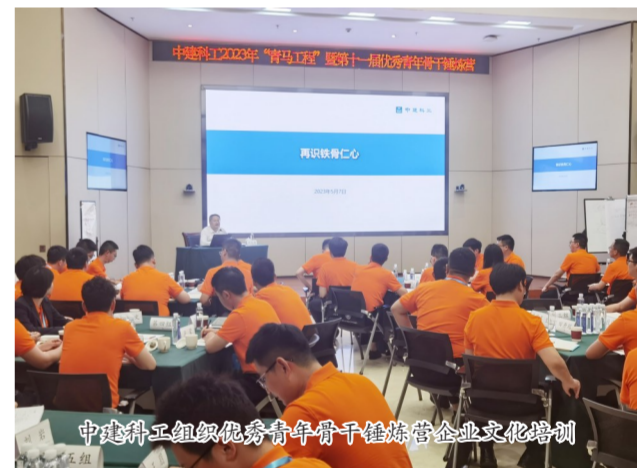
中建科工组织优秀青年骨干锤炼营企业文化培训

结合主题教育推动发展、检视整改等重点举措要求,以中建交通“两优四强”战略目标为导向,制定发布公司价值创造行动方案,规划8大类、73项具体任务举措,不断深化改革,增强发展动能,助力集团加快建设世界一流企业。