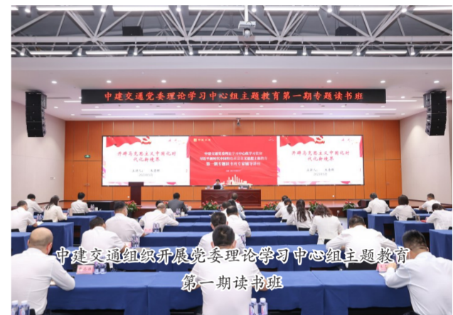
中建交通党委理论中心组主题教育第一期专题读书班

坚持从一开始就改起来,成立整改整治办公室,采取台账式管理、项目化推进的方式开展主题教育集中整治,切实将主题教育成果转化成为开启企业高质量发展新未来的“金钥匙”。