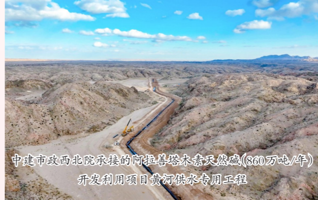
中建市政西北院承接的阿拉善塔东露天煤矿(860万吨/年)开发利用项目黄河供水专用工程

强化问题导向、实践导向、需求导向,聚焦落实集团第十五次海外工作会议精神和年度“稳增长、谋创新、促治理、防风险、强党建”五大任务,紧紧围绕公司“体系建设强化年”年度主题,确定实体化经营、人力资源管理体系建设等“三大攻坚战”,分别制定专项攻坚方案,明确7大类28项重点举措,提级挂牌作战,加快推进实体化经营,切实把主题教育学习成效转化为坚定理想、锤炼党性的高度自觉,转化为做好本职工作、推动事业发展的生动实践。