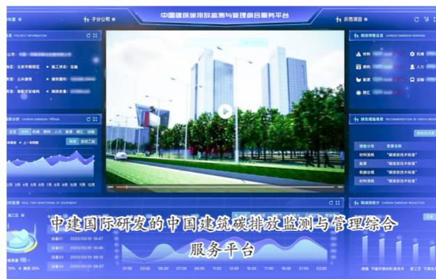
中建国际研发的中国建筑碳排放监测与管理综合服务管理平台

各子企业坚持把开展主题教育同贯彻落实习近平总书记重要指示批示和党中央决策部署结合起来,推动主题教育深入开展,取得实效。