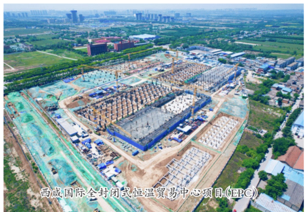
西咸国际全封闭式恒温贸易中心项目(EPC)

各子企业采取“第一议题”及时学、理论学习中心组深入学、创新方式自主学等多种形式,推动学习贯彻习近平新时代中国特色社会主义思想往深里走、往心里走、往实里走。