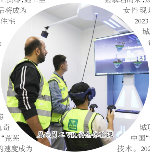
属地员工VR安全体验课

建筑是凝固的艺术，城市就是展览馆。如今，106交易塔静静伫立在车水马龙的都市中央，俯视着吉隆坡的城市景观，也成为这座城市最耀眼的点缀。