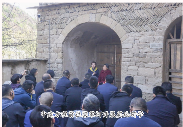
中建方程前往梁家河开展实地研学

在主题教育中突出传承“战旗精神”,开展“战旗领航 奋斗拓新 建证未来”主题活动,邀请“在党50年”老党员讲述公司支援新疆、建设边疆的发展历程。组织党员、青年自导自演红色剧本,情景再现“跨时空对话”,重温峥嵘岁月,感悟红色伟力。组织参观红色教育基地,开展“重走长征路”等主题党日活动,实地聆听红色故事。通过形式多样的“红色课堂”,增强主题教育吸引力感染力,激励党员干部为推进“立足新疆、东进西出”发展战略汲取奋进力量。