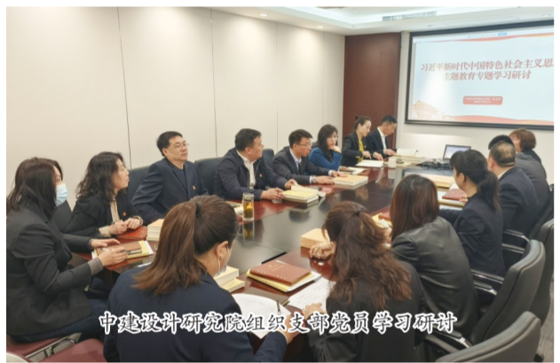
中建设计研究院组织支部党员学习研讨

确定“1235”调研思路,坚持“以高质量调查研究助推企业高质量发展”调研目标,树立“领导较真、员工认真”调研态度,发扬“真情怀”察实情、“真本领”出实招、“真口碑”见实效的“三真三实”调研作风,聚焦大营销、大商务、大履约、大安全、大党建五项调研重点,精选22项课题,用好6种调研方式,深入开展调查研究,着力解决发展瓶颈问题、顽瘴痼疾问题、急难愁盼问题。