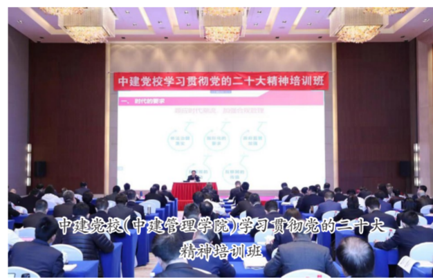
中建党校(中建管理学院)学习贯彻党的二十大精神培训班

及时召开党委会议,以“第一议题”学习习近平总书记有关主题教育系列重要讲话精神,并将理论学习作为首要任务贯穿主题教育始终,做到“四级贯通、一个带动”,即贯通“党委-党支部-党小组-党员”四级主体责任学习,带动青年干部提升精神素养,进一步筑牢信仰之基,补足精神之钙,把稳思想之舵。