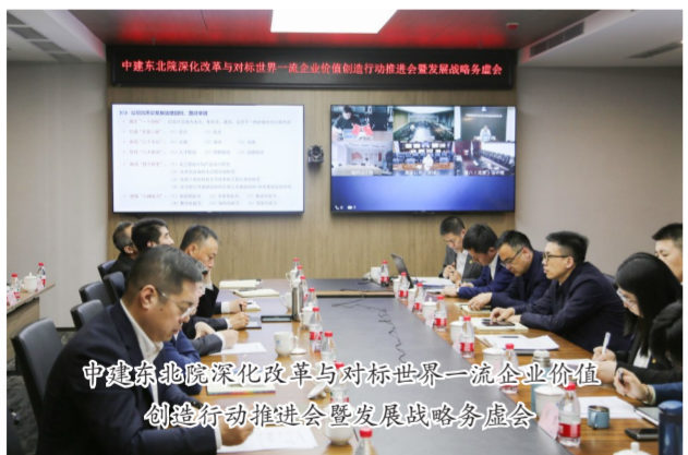
中建东北院深化改革与对标世界一流企业价值创造行动推进暨发展战略务虚会

中建设计研究院凝练细化主题教育工作要求和重点举措,对6个方面学习形式和6项具体理论学习任务做出细致部署。凝练细化主题教育工作要求和重点举措,对读书班、中心组学习、讲党课、支部党员学习、群众性主题教育实践、理论学习研究成果等6个方面作出具体安排,明确16项理论学习具体任务;细化17项具体调研内容及6个工作步骤,选定7个调研综合课题和10个专项课题;梳理21个主题教育宣传重点,充分利用各级媒体和传播手段,营造良好舆论氛围。