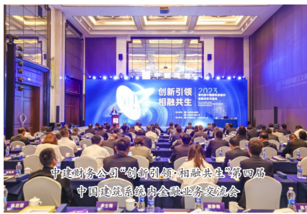
中建财务公司“创新引领·相融共生”第四届中国建筑系统内金融业务交流会

中建方程坚持学思用贯通,知行信统一,在学习中提升理论素养,在实践中锻造过硬本领,通过将教学与实践相结合,进一步筑牢信仰之基、补足精神之钙、把稳思想之舵。在中国延安干部学院举办主题教育专题培训班,通过实地研学,近距离汲取精神力量。公司领导干部发挥头雁作用,带头学习研讨。邀请非党员领导干部、入党积极分子围绕中心工作,参与支部学习研讨,在深思笃学中提高理论素养,增强能力本领,激发攻坚克难、干事创业的工作热情。