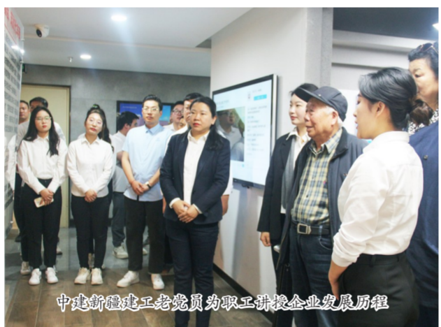
中建新疆建工老党员为职工讲授企业发展历程

开展党委理论中心组联学,深入学习贯彻习近平总书记有关主题教育系列重要讲话精神和《习近平著作选读》《习近平新时代中国特色社会主义思想专题摘编》等书目内容。双方领导班子坚持目标导向和问题导向,围绕新一轮国企改革深化提升行动,全面深入推进战略性协同联动,实现规模和质量双突破等主题,深入开展集中交流研讨,研究提出解决问题、推动发展的新思路、新举措。