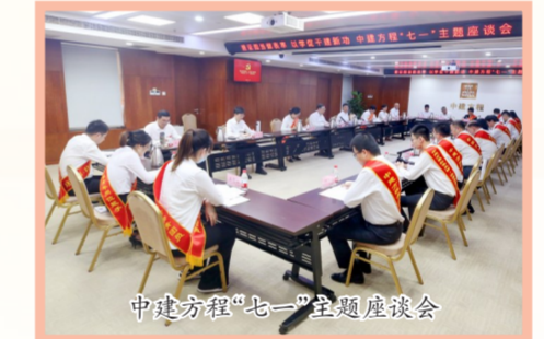
中建方程“七一”主题座谈会

来”青年志愿服务、重访红色地标工程、组织联建共建等方式赓续红色血脉、传承红色基因。中建装饰毛主席纪念馆志愿服务临时党支部为瞻仰群众提供信息咨询、扶弱助残等服务,践行“为主席站岗 为人民服务”的光荣使命;中建东方装饰西北分公司党支部与中外园林陕西分公司党支部赴延安市南泥湾革命旧址开展联学联建,深刻领悟南泥湾精神。