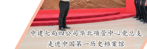
中建七局四公司华北项管中心党总支走进中国第一历史档案馆

中建八局党委举办“学思想 强党性 重实践 建新功——庆祝中国共产党成立102周年 表彰大会暨先进事迹报告会”,表彰先进典型,讲述八局基层党组织和广大党员奋战雪域高原、参与丝路建设、攻坚急难险重任务和助推企业改革发展中展现出的