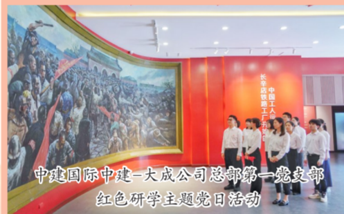
中建国际中建-大成公司总部第一党支部红色研学主题党日活动

中建七局积极组织基层党组织开展“学思想、见行动”主题系列活动,引导广大党员干部职工坚定不移听党话、跟党走。