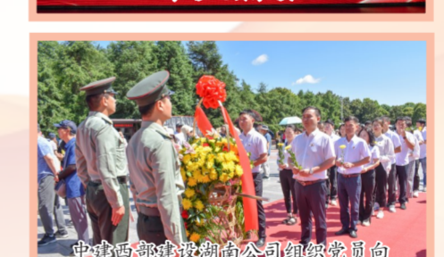
中建西部建设湖南公司组织党员向毛泽东铜像敬献花篮

来”青年志愿服务、重访红色地标工程、组织联建共建等方式赓续红色血脉、传承红色基因。中建装饰毛主席纪念馆志愿服务临时党支部为瞻仰群众提供信息咨询、扶弱助残等服务,践行“为主席站岗 为人民服务”的光荣使命;中建东方装饰西北分公司党支部与中外园林陕西分公司党支部赴延安市南泥湾革命旧址开展联学联建,深刻领悟南泥湾精神。