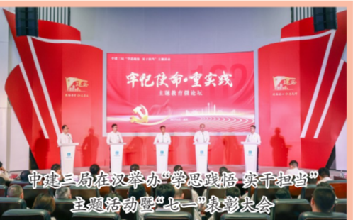
中建二局在汉举办“学思想悟道 实干担当”主题党日活动暨“七一”表彰大会

中建西南院(西南区域总部)积极组织各基层党组织开展“学思想、见行动”主题系列活动,