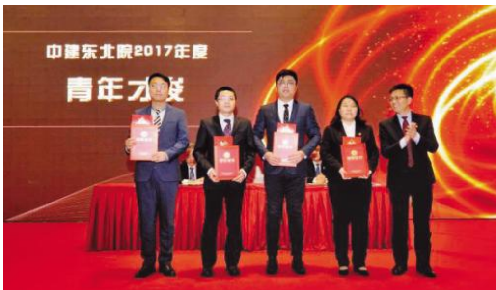
院领导向青年才俊荣誉称号获得者颁奖