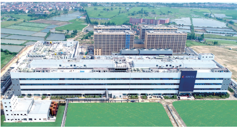
日前,中建一局二公司履约的亚洲单层面积最大的电子厂房工程——南昌高新电子产业园一期项目投入使用。(贺志林)