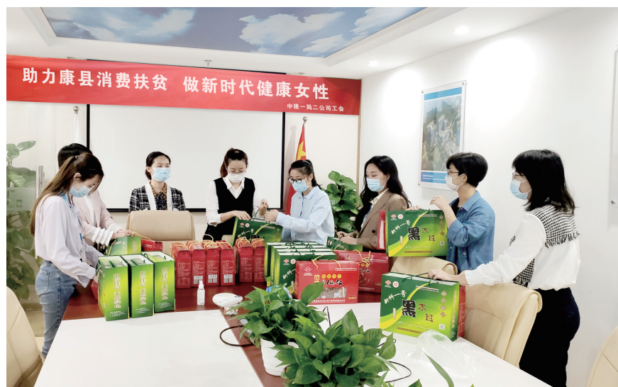
近日,中建一局统筹全局各子企业采购甘肃陇南市康县、康乐县核桃和木耳等农产品,贷款总金额81.8万余元,帮助当地农民解决农产品销售难问题,为决战决胜脱贫攻坚、打赢脱贫攻坚战贡献力量。(品萱)

“制度的生命力在于执行,大家不要小看‘认罚’这件事,只要我们都站出来敬畏制度、维护制度、落实制度,我们的执行力才能上去,高质量发展才能实现。”在最近一次区域班子扩大会上,朱峰总结说。