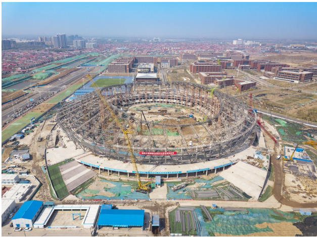
近日,由中建科工承建的2022年河北省运会主场馆——河北省邯郸市体育中心EPC项目主体结构封顶,较计划提前了一个月。(田帅)