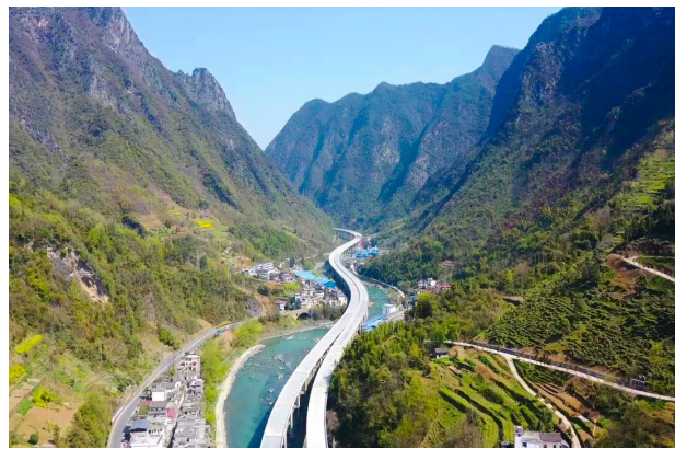
近日,由中建路桥承建的陕西段安(康)至岚(皋)高速公路相子坝特大桥全线贯通。安岚高速是国家高速公路银川至百色线的重要组成部分,该桥贯通为高速按时竣工打下坚实的基础。(赵攀飞)