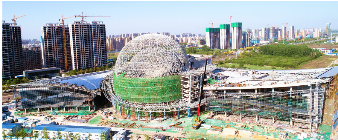
近日,中建七局商丘文化艺术中心项目迎来核心区大剧院球幕幕墙施工阶段,为下一步大剧院内部精装、舞台机械安装等专业施工奠定基础,标志着工程开始由主体施工转向内部安装阶段。该项目是商丘市重点项目,也是商丘市最大的公共文化建设项目,目前主体结构、钢结构已全部完成。(杨素)

守护会展,绽放光彩的巾帼将;幸福会展,支撑家庭的顶梁柱;奋发会展,矢志前行的追梦人;保障会展,红线之内的响铃铛;热血会展,担当奉献的急先锋;实干会展,工程建设的弄潮儿;有为会展,勇于亮剑的真勇士……这群有血有肉、有情有义的建设者,以热血冲进度,以奋斗抵风雨,以赤诚保质量,以匠心筑品质,用三个春节的坚守,用内蕴于心的家国情怀,在浐灞之滨谱写了一曲慷慨激昂的战斗乐章。这颗丝路“明珠”镌刻着八局铁军的智慧、汗水与匠心,将以崭新的姿态,在“一带一路”上绽放出耀眼的光芒。