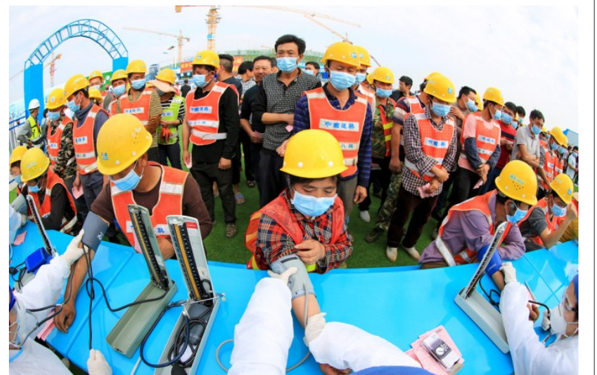
连日来,中建八局南方公司汕头亚青会场馆、广西医科大学附属五象新区医院、河源基础设施配套工程等重点项目全面复工达产。为确保项目安全施工、高效生产,共计4000余名工友接受免费体检服务,确保项目安全复工。(黄迪)