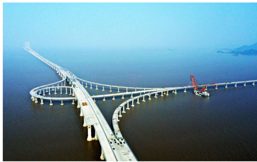
近日,中建桥梁承建的宁波舟山港主通道项目舟岱大桥实现全桥贯通,计划于2021年底全线建成通车,届时将彻底结束大桥沿线岛屿海上悬岛的历史。(胡永建)