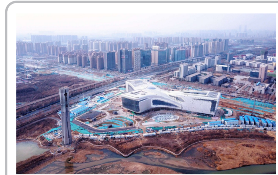
近日,中建三局、中建装饰承建的河南省科技馆新馆项目竣工。项目是河南省有史以来财政全额投资最多、规模最大的公益性投资项目。(董森)

2018年以来,中建五洲不仅掌握了丙烷脱氢核心装置核心技术,而且攻克了回转类设备的制造难点,掌握了大型设备现场制作要点。依托当时全球首套、单台最重、产能最大的丙烷脱氢项目核心装置项目——青岛金能90万吨/年丙烷脱氢项目,中建五洲开展分离塔现场分段制造、分段热处理和空中合龙技术等制作技术研究,最终实现了3000吨级大型设备现场空中分段合龙,开辟了大型塔器现场制作的先河。凭借生产工艺的先进性、产品质量、安全性,中建五洲获得了业内过硬的口碑,顺利承接了东莞巨正源120万吨/年二期60万吨/年丙烷脱氢等多个项目。