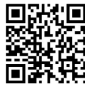
扫码关注更多资讯

“十四五”时期,中国建筑将打造技术、大数据和云计算三大平台,建设数字指挥决策、产业链数字化、海外信息化提升、企业管理协同、产业互联网奠基与信息化基础设施云化六大项目群,赋能企业高质量发展。