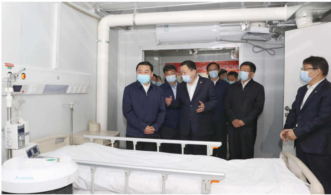
肆虐时,以中建集团为代表的广大央企建设者,视疫情为命令,召之即来、来之能

去年在同疫情的殊死较量中,国资央企全力投入湖北、武汉抗疫主战场,勇担专门医院建设重任,为疫情防控作出了突出贡献。3月26日上午,郝鹏专程来到火神山医院,听取火神山医院建设情况和中建集团抗疫情况介绍,进入医院病房查看设施、设备,看望中建三局参建火神山医院、雷神山医院的职工代表。他指出,在疫情