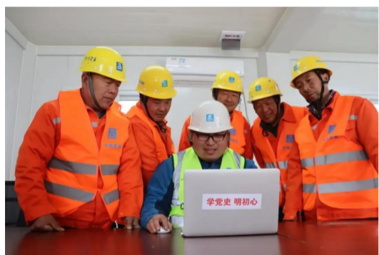
中建六局轨道交通公司各项目部党支部成立“心动力”宣讲组,推动项目党员干部与农民工友共同学习。(孟晓)