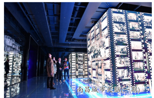
南昌城市大脑(一期)

数据中心建设搭建运营“智慧脑”。从“智慧社区”到“智慧城市”,从“数字化生产”到“云商业”,海量数据存储和处理离不开数据中心的支撑。在数字化技术日益普及的今天,算力成为核心生产力,数据中心成为数字化时代的“新基建”。中建集团紧跟国家部署,持续发力新一代数据中心建设,为数字化转型贡献力量。2020年11月15日,中建集团承建的南昌城市大脑(一期)上线试运行。同月,在2020全球智慧城市大会年度颁奖典礼上,南昌城市大脑“文明创建”斩获2020世界智慧城市大会中国赛区创新理念大奖。“该工程分为三期,是南昌市重点民生工程和智慧工程,是南昌市政服务中心,也是江西省首个大型数据服务中心。”中建三局该项目负责人介绍。目前,一期建成上线了南昌交通不限行、“舒心停车·先离场后付费”、文明创建不下线、扶贫不落一人、优惠政策直达、先看病后付费等六大场景。项目建成后助力南昌智能化建设,为政府精准施政提供技术支撑、向社会提供优质便捷的数字应用场景,打造智慧城市“南昌样板”,推动南昌数字经济发展。