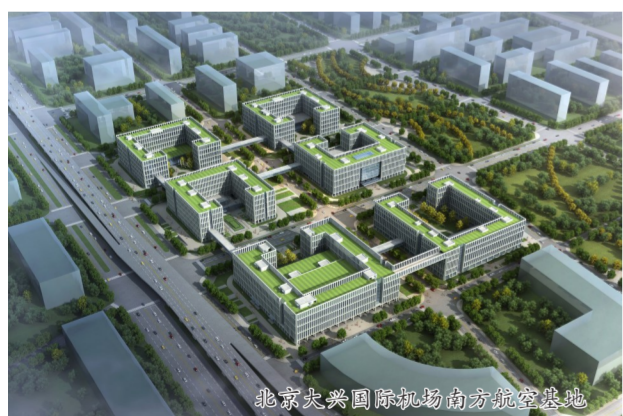
北京大兴国际机场南方航空基地

绿色建造助力中国建造低碳化。北京大兴国际机场南方航空基地作为目前亚洲最大的运行控制中心,中建集团创新实践了由建筑师负责的“绿色建筑协同设计方法”,建立绿色建筑协同设计软件平台,实现全过程、多主体、全专业协同的优化设计、节点深化、建材比选和设备选定的协同工作,配合模块化的设计建造,有效提升了被动式设计下的建筑性能,达到了高性能、可数字验证的节能效果。从建筑设计方法着手的大量超低能耗绿色建筑技术手段,在不增加设备及造价的同时,实现了建筑艺术与绿建技术的和谐统一,创造了一个与阳光、微风、景观共舞的绿色展览空间,极大降低了后期运行及维护费用。