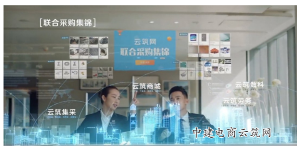
运营“新业态”助力城市治理更智慧

产业互联网增添建筑业“新动力”。不光会议、招聘战线上,建筑业全产业链也愈来愈“互联网+”。“十三五”以来,我国互联网事业蓬勃发展,取得举世瞩目的成就。中建集团践行国家“互联网+”战略,以中建电商云筑网为载体,积极推动建筑业和互联网跨界融合,培育新的业务增长点。作为建筑行业领先的互联网综合服务商,中建电商云筑网拥有云筑集采、云筑优选、云筑劳务、云筑智联、云筑数科5个子品牌。火神山雷神山医院建设期间,云筑网就曾通过强大的资源统筹能力,累计为“两山医院”项目配送超过100万件零星材料,总金额达1700多万元,在抗击疫情的关键时期贡献了重要力量。除此之外,针对境内外项目的防疫需求,云筑劳务平台以劳务实名制管理为核心,将建筑工人的“实名制一卡通”与身份信息、工地门禁闸机、体温信息一一对应,实时记录进出场等数据,帮助建筑企业做好群防群控,确保防疫、复工两不误。