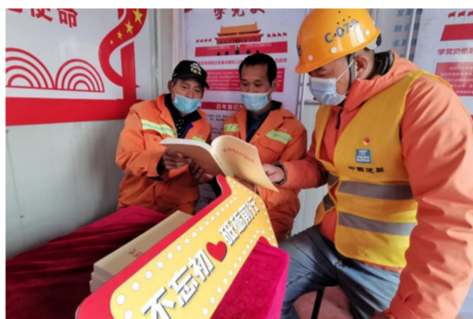
中建七局打造项目党支部党史驿站,全面服务一线党员,打造覆盖项目一线的党史学习教育“红色加油站”。(刘凤霞、高亦谈)