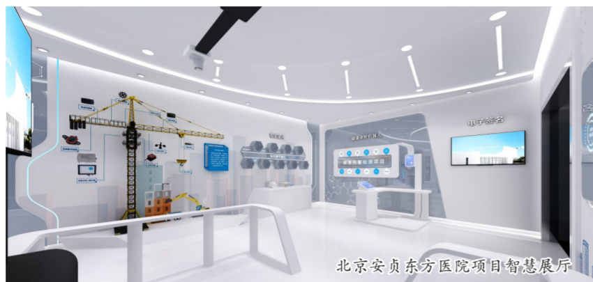
北京安贞东方医院项目智慧展厅

随着5G、人工智能、物联网等新技术的普及,中国建筑以实施国企改革三年行动为契机,积极开展信息化建设、两化融合、数字化和智能化转型,为企业高质量发展提供强大驱动力。