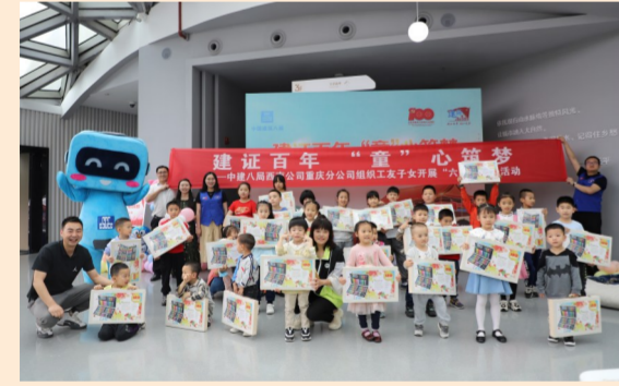
中建八局西南公司在重庆悦来美术馆开展“建证百年·童”心筑梦”六一亲子活动,重庆地区职工与家属和子女欢聚一堂,陪伴童年,守护童心,共度美好的节日时光。(冉仕莉)