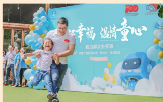
中建二局四川分公司启动“建证幸福·温暖童心”行动,通过订制心愿清单,邀请孩子们到工地反探亲,建立专项奖学金等举措,增强父母和留守子女的陪伴与交流,让团聚更暖心。(唐钰琦、尹婷)