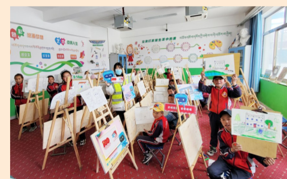
中建一局二公司“建证百年 同心筑梦”援藏活动志愿者与西藏扎西宗乡小学孩子们一起绘梦想、践初心,以中建力量温暖更多“格桑”。2019年起,公司累计为西藏孩子们捐赠爱心物资8万余件。(李星逸)