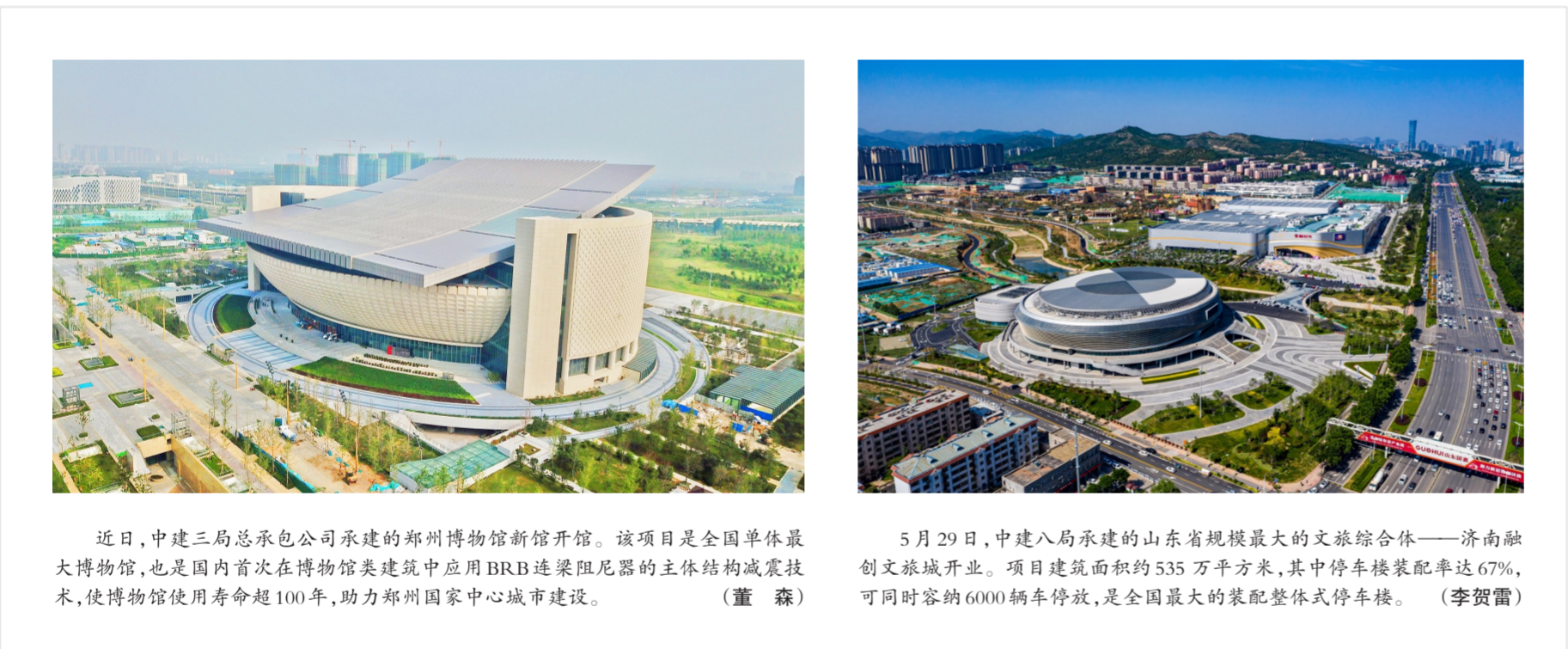
近日,中建三局总承包公司承建的郑州博物馆新馆开馆。该项目是全国单体最大博物馆,也是国内首次在博物馆类建筑中应用BRB连梁阻尼器的主体结构减震技术,使博物馆使用寿命超100年,助力郑州国家中心城市建设。(董森)

近日,中建科工承建的华为东莞团泊洼云数据中心(T4)项目完成竣工验收。建成后支撑起华为未来10至15年发展目标,服务170个国家与地区的17万人,被称为“华为心脏”。(李淇、熊显峰)