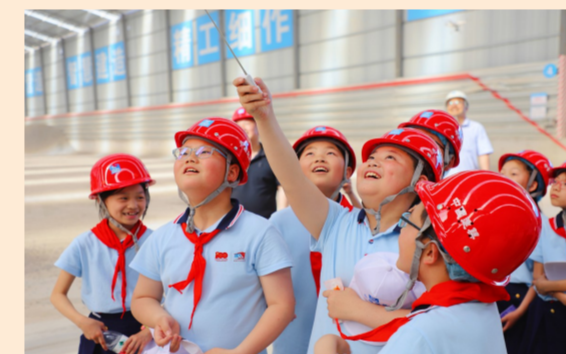
中建七局交通公司许昌高速项目联合属地小学开展“建证百年 同心筑梦”主题活动,组织学生们到项目参观,在智慧工地中拓展课外知识,激发学习兴趣,筑梦童心。(王亚辉、李东航)