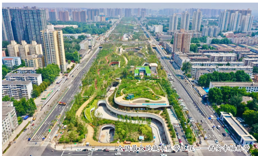
全国最大的城市绿带工程——西安幸福林带

中国建筑服务助力十四运的足迹还在向地下延伸。五湖四海的游客观众相聚西安、汇聚于比赛场馆,最便捷的交通方式里就有中国建筑的身影。6月29日,西安地铁“全运线”、全国首个线路级智慧