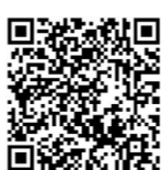
扫码关注更多资讯

中建三局党委书记、董事长陈卫国表示：“我们将深入贯彻落实党的二十大精神，牢固树立和践行‘绿水青山就是金山银山’的理念，从人与自然和谐共生的高度，继续以赤诚之心和央企担当，用行业领先的绿色建造技术点亮一幅幅生态画卷，为湿地保护与生态修复贡献智慧，以实际行动建设美丽中国。”