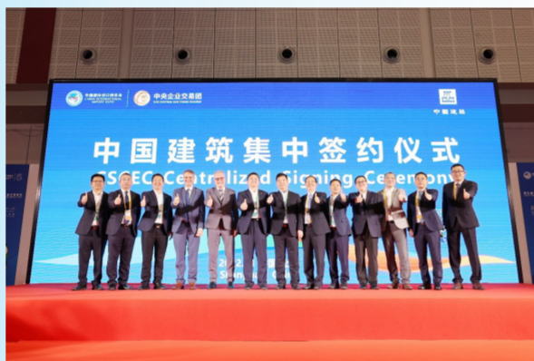
第五届进博会中央企业交易团中国建筑集中签约仪式