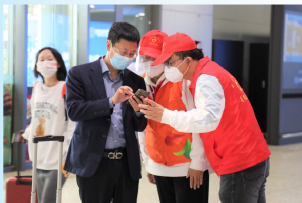
中建一局先锋志愿者为进博会观展者提供志愿服务