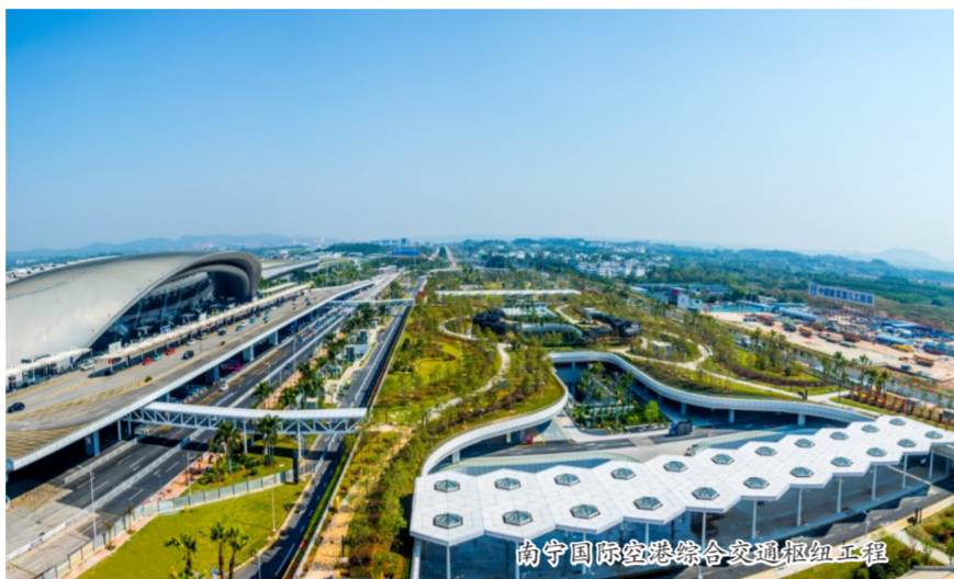
南宁国际空港综合交通枢纽工程

2015年3月全国两会期间，习近平总书记参加广西代表团审议时明确指出广西发展“三大定位”——构建面向东盟的国际大通道，打造西南中南地区开放发展新的战略支点，形成21世纪海上丝绸之路和丝绸之路经济带有机衔接的重要门户。