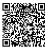
扫码关注更多资讯

在“生态优先”理念的引领下，项目团队在环网交通、下沉广场的建设过程中研发并应用AI数字化智能建造管理平台，集成8大项35项BIM技术应用，将绿色装配式边坡防护技术等绿色建造技术同信息化手段相结合，实现绿色建造、安全建造及高效建造，助力实现“双碳”目标。