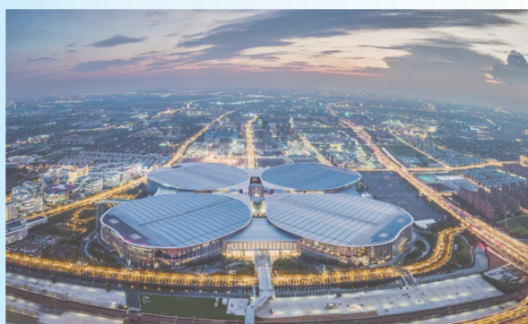
第五届进博会举办场馆——国家会展中心(上海)

会上首次发布“2022年中国企业社会责任碳中和年度先锋”奖项，组委会综合衡量自2020年以来积极致力于碳中和行动、勇于承担绿色发展社会责任的企业，并通过多个维度进行综合评定，筛选出了一批具有代表性的优秀企业，致敬碳中和发展道路上的时代先锋。