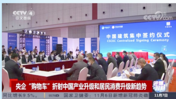
中央广播电视总台报道中国建筑与一批海外供货商签署战略合作协议

素材来源：项目履约管理部，中建一局，中建二局，中建三局，中建五局，中建八局，中建发展