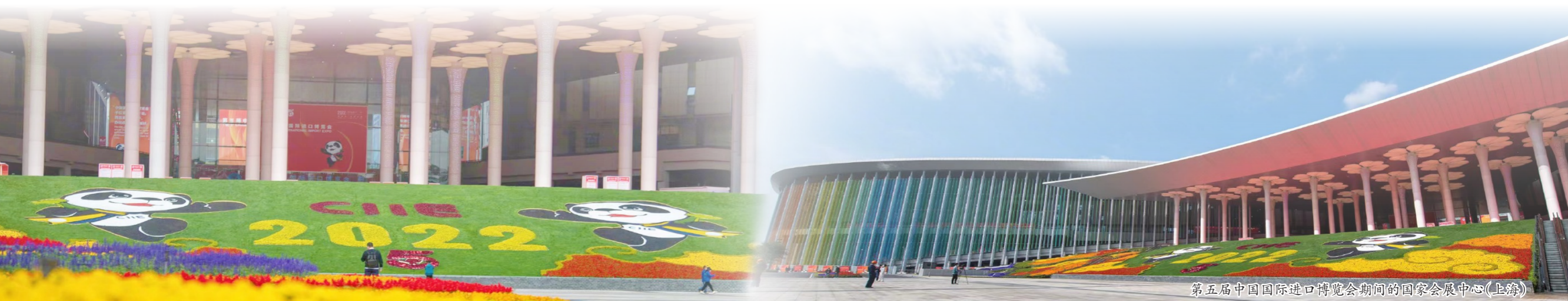
第五届中国国际进口博览会期间的国家会展中心(上海)