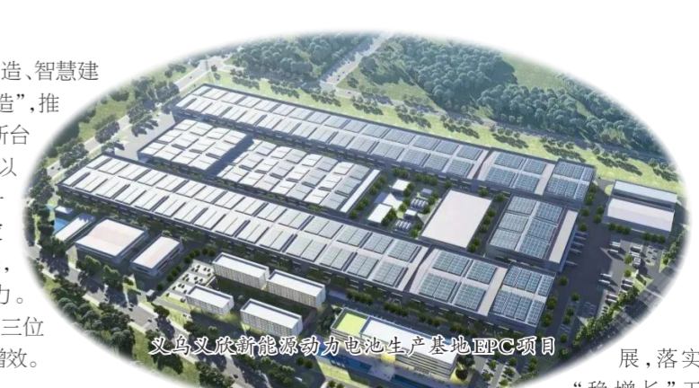
义乌市新能源动力电池生产基地EPC项目

深化改革创新。“创新才能把握时代,引领时代”。我们要进一步用理论武装头脑,把握时代脉搏,掌握行业动态,深化企业改革发