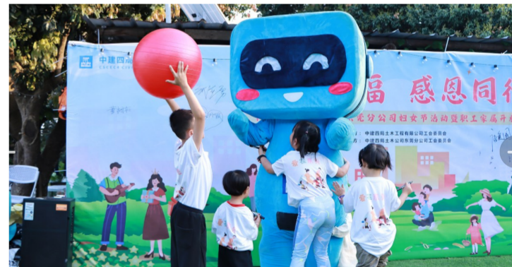
3月5日,中建四局土木公司举行“建证幸福 感恩同行”职工家属开放日活动,50余个职工家庭共赴幸福之约,积极参与抢球大战、草坪音乐会、围炉煮茶等各类趣味活动。(文水香)