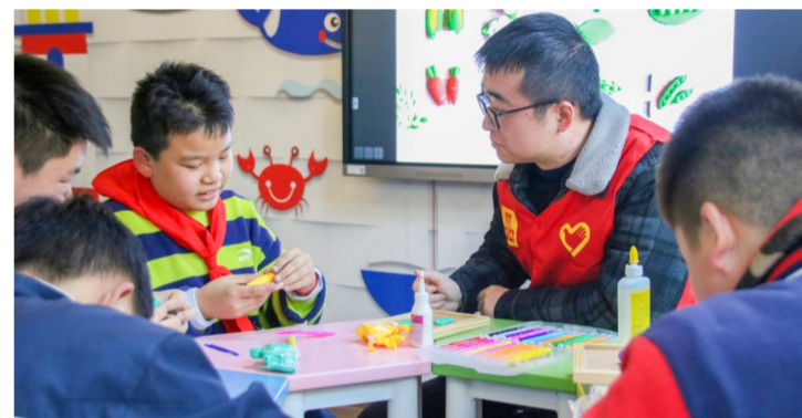
近日,中建三局数字公司“初心”志愿者服务队联合上海虹口区彩虹笔儿童健康发展中心,赴虹口区教育学院附属中学开展“学雷锋”志愿活动,陪伴自闭症儿童上课并进行橡皮泥手工教学。(邓浩)