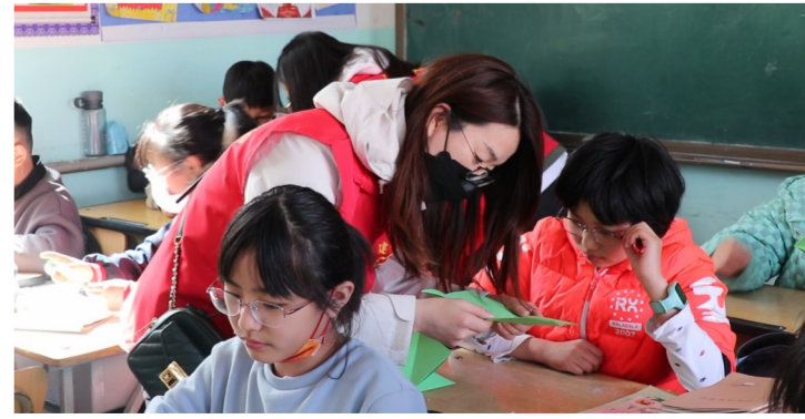
3月5日,中建装饰总承包公司“建证未来”志愿者前往北京市房山区民仁学校开展流动儿童关爱主题活动,为孩子们讲述雷锋故事,组织开展“一圈到底”、跳绳、羽毛球等体育游戏。(陈溪溪)