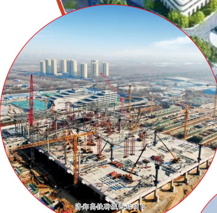
济滨高铁聊城西站项目

起步即冲刺、奋力抢开局,中建八局一公司将秉承“实干为要、价值为纲”,用高质量发展成果为稳增长大局贡献应有之力。