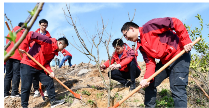
3月10日,中建科工湖北大冶湖文化综合体项目开展“绿植心间”特色志愿服务,项目员工分工合作,在500亩盐碱地上共同完成植树任务,并开展“识绿问答”,推动形成爱绿护绿文明风尚。(王成文)