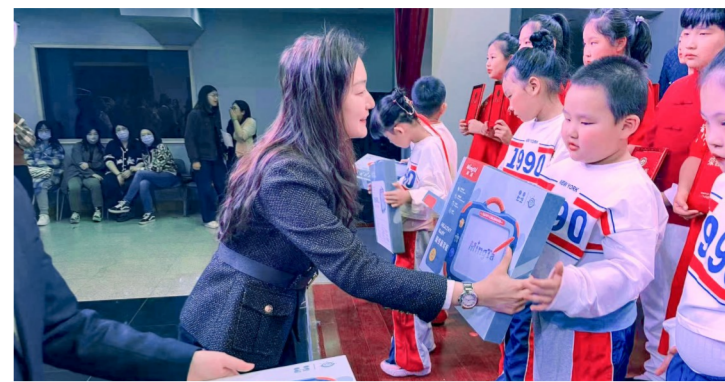
近日,中建一局建设发展公司华北分公司联合属地单位策划关爱孤独症儿童公益汇演志愿服务,并与孤独症学校签订对口帮扶意向书,捐赠儿童生活用品及康复训练玩具。(袁婷)