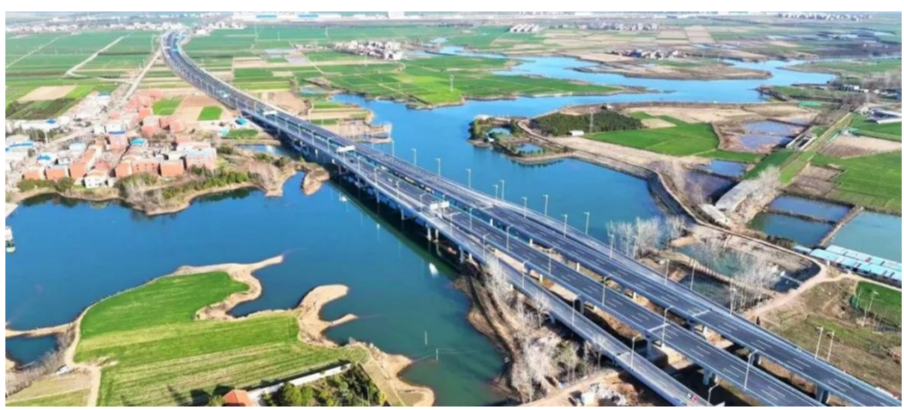
中建三局基建投公司参建的湖北襄阳市首条城市快速路——襄阳襄江大道全线通车。项目位于湖北省襄阳市，被誉为襄阳市的“金腰带”。襄江大道全长约27公里，全程不设一个红绿灯，是襄阳首条真正意义上的城市快速路，实现了城市快速路与国家高速公路网无缝对接，是联系樊城与东津新城中心区最为便捷的交通通道，对构建半小时市区通勤圈、优化“一心四城”空间格局、提升中心城市能级具有重大意义。(李朝琴、聂艺)