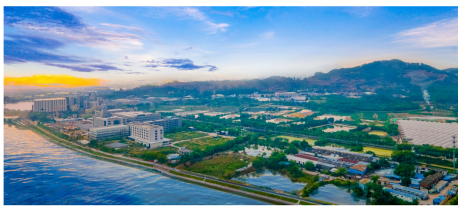
中建一局建设发展公司承建的佛山里水河流域治理项目西线补水工程正式通车。项目位于广东省佛山市南海区里水镇，项目涉及流域面积达66.01平方千米，涵盖7个片区、3条主干涌、8条支涌以及82条支涌，共93条河道。截至目前，佛山市南海区里水河流域治理项目累计建成截污管网32.9千米、补水管18.9千米、景观绿化9.7万平方米，清淤工程累计完成51.3万立方米。治理后将有效守护珠江上游生态屏障，从源头助力珠江流域水治理目标。(品 萱)

壮美边关路，匠心筑八桂。中国建筑逢山开路、遇水架桥，以兴边富民的初心，精益求精的匠心，精心铸就品质工程，不断织密八桂大地高速公路网。