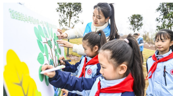
3月13日,中建二局西南公司联合重庆滨江四牌坊小学开展“我的幸福梦一起‘浇’朋友”志愿服务,与属地小学生一起开展植树种“梦想”、我为公园添点绿等活动,助力绿水青山建设。(曾蓉)