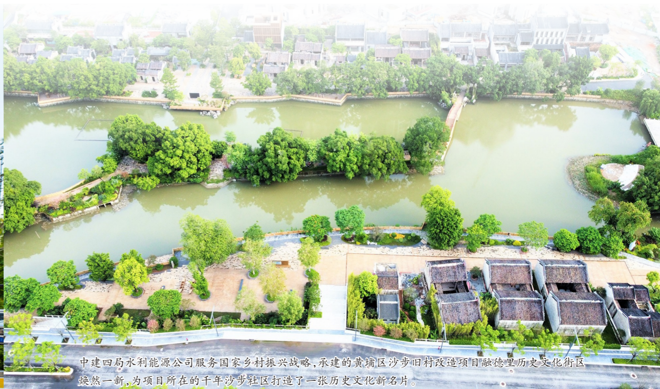
中建四局水利能源公司服务国家乡村振兴战略,承建的黄浦区沙步旧村改造项目融德里历史文化街区焕然一新,为项目所在的千年沙步社区打造了一张历史文化新名片。