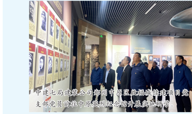
中建七局建装公司郑州中原区殷福城续建项目党支部党员前往中原英烈纪念馆开展实地研学。

中建国际城市建设公司通过中心组研学、集体研讨、联学联建等方式,深入学习贯彻习近平总书记关于绿色发展的重要论述,在苏州市集成电路创新中心(二期)、南京大学苏州校区(西区)项目等江苏省重点项目,启用目前江苏省最大的防尘降噪“天幕”系统,率先在全国工程行业使用临建绿电光伏系统,以“绿色建造”践行“双碳”理念。