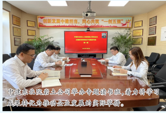
中建东北院岩土公司举办专题读书班,着力将学习成果转化为推动企业发展的实际举措。