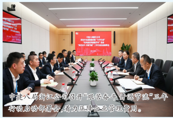
中建八局浙江公司召开“艰苦奋斗、开源节流”三年行动启动部署会,着力压降企业管理费用。