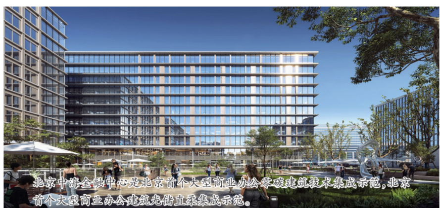
北京中海金融中心是北京首个大型商业办公零碳建筑技术集成示范,北京首个大型商业办公建筑光储直柔集成示范。

通过内外部全面研究,总结关键结论,中国海外发展制定了“1333”战略规划,即以“碳达峰”“碳中和”为1个核心,