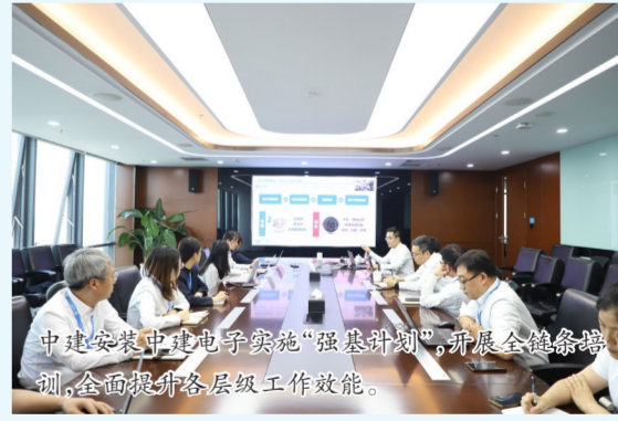
中建安装中建电子实施“强基计划”,开展全链条培训,全面提升各层级工作效能。