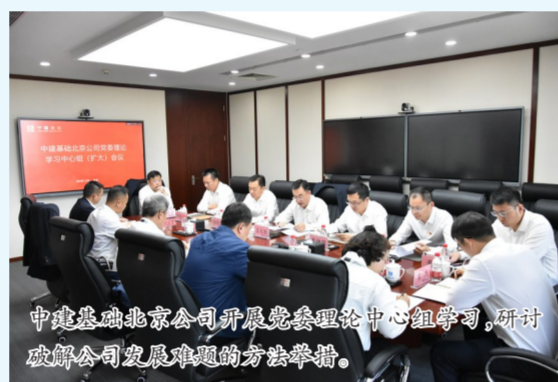
中建基础北京公司开展党委理论中心组学习,研讨破解公司发展难题的方法举措。