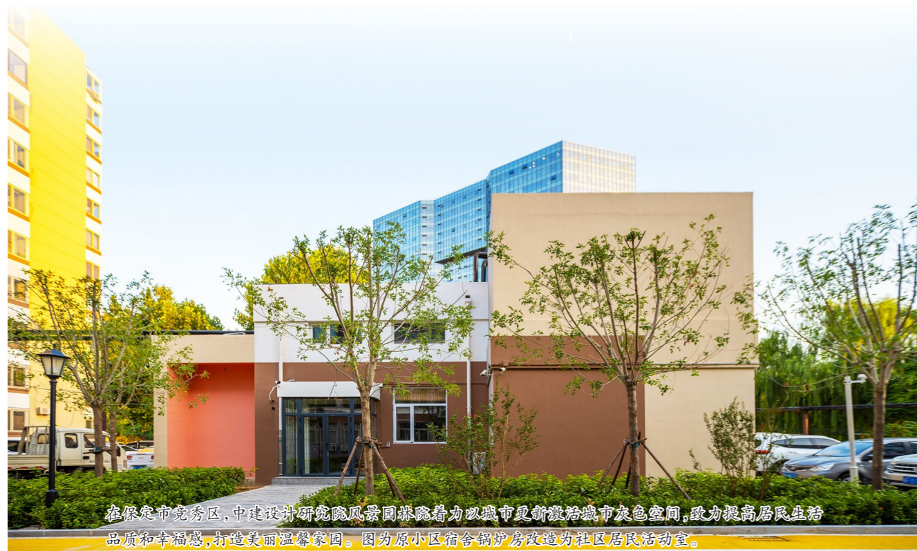
在保定市竞秀区,中建设计研究院风景园林院着力以城市更新重塑城市灰色空间,致力提高居民生活品质和幸福指数,打造美丽温馨家园。图为原小区宿舍锅炉房改造为社区居民活动室。