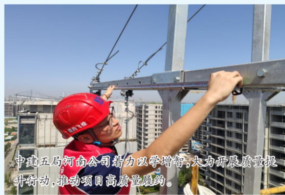
中建五局河南公司着力以学增智,大力开展质量提升行动,推动项目高质量履约。