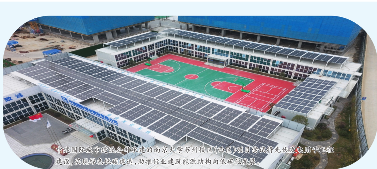
中建国际城市建设公司承建的南京大学苏州校区(西区)项目尝试将光伏发电用于工程建设,实现绿色低碳建造,助推行业建筑能源结构向低碳化发展。

中建设计研究院风景园林院注重掌握和运用科学思想方法,积极推进保定市137个社区改造项目,推动低效土地复合利用,融合人本生活与文化教育,创新性提出全国可复制可推广的老旧小区改造和提升模式,通过场景设计、建管结合等手段激发城市衰退空间的活力,带动城市复兴发展。