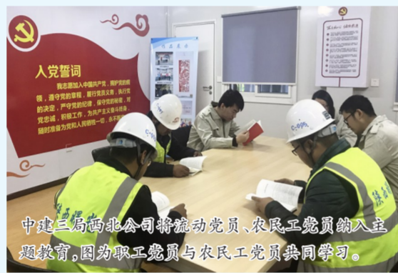
中建三局西北公司将流动党员、农民工党员纳入主题教育,图为职工党员与农民工党员共同学习。