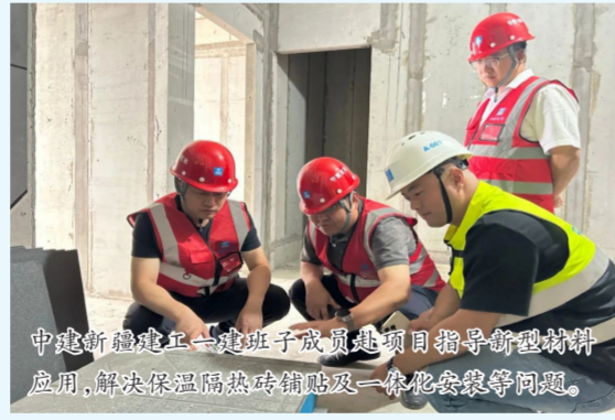
中建新疆建工一建班子成员项目指导新材料应用,解决保温隔热砖铺贴及一体化安装等问题。