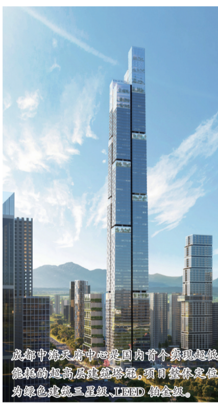
成都中海天府中心是国内首个实现超低能耗的超高层建筑塔冠,项目整体定位为绿色建筑三星级、LEED铂金级。

本报讯(通讯员刘鹏)11月23日,《中国海外发展碳中和白皮书》正式发布。以该白皮书为指导,中国海外发展以“全程减碳、领先示范、促进发展”三大核心方向,分阶段制定企业减碳行动,推进自身及产业价值链的低碳发展,助推实现经济发展质量变革。